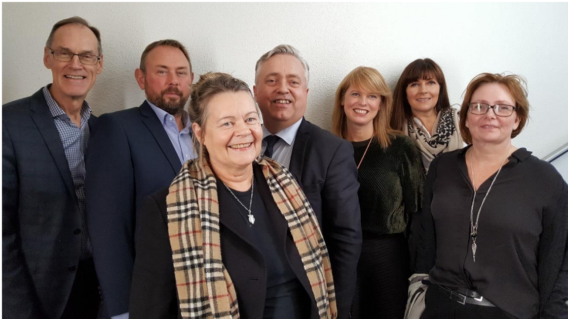
Stjórn Félags forstöðumanna ríkisstofnana 2016 – 2017.